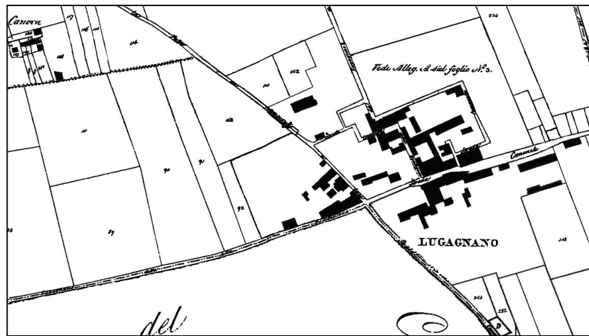
dal catasto austriaco